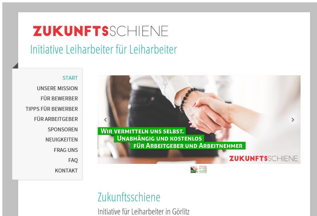
Abbildung 1 www.zukunftsschiene.de